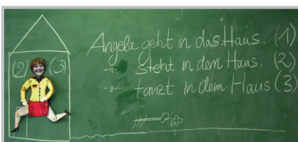
Scholieren verschillen sterk van mening of ze de lessen (redelijk) makkelijk vinden. Afwisselender mag het vooral.

De ideale leraar Duits is iemand die langere tijd in Duitsland heeft gewoond, het land goed kent en er enthousiast over kan vertellen. Bovendien moet de leraar in staat zijn de klas onder controle te houden, zorgt hij/zij voor afwisseling, is grappig, spreekt Duits tijdens de les en kan goed uitleggen.