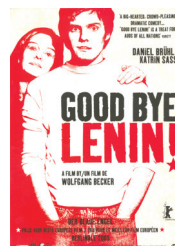
Het kijken naar een Duitstalige film of het luisteren naar Duitse muziek wordt ook zeer gewaardeerd door scholieren.