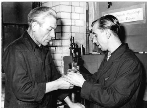
10. Januar 1955